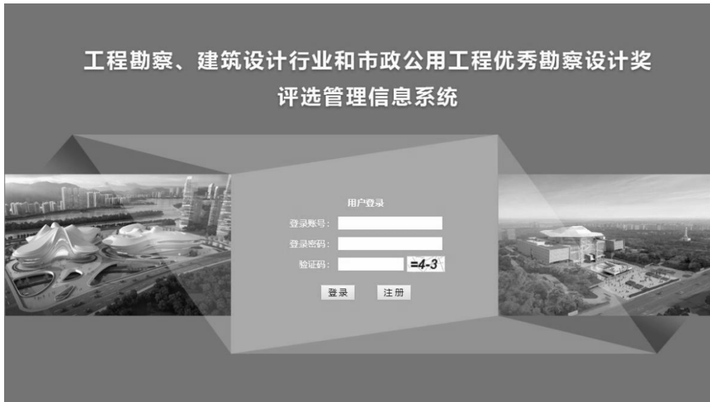
图 2 评选管理信息系统登录界面示意

各申报单位通过浏览器进入“行业优秀勘察设计奖评选管理信息系统”，输入账户和密码登录系统。如图 2: