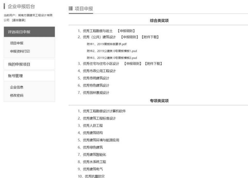
图 3 评选管理信息系统项目申报界面示意

登录系统进入项目申报页面，可浏览申报奖项类别，下载各奖项申报细则和展板模板等文件。如图 3: